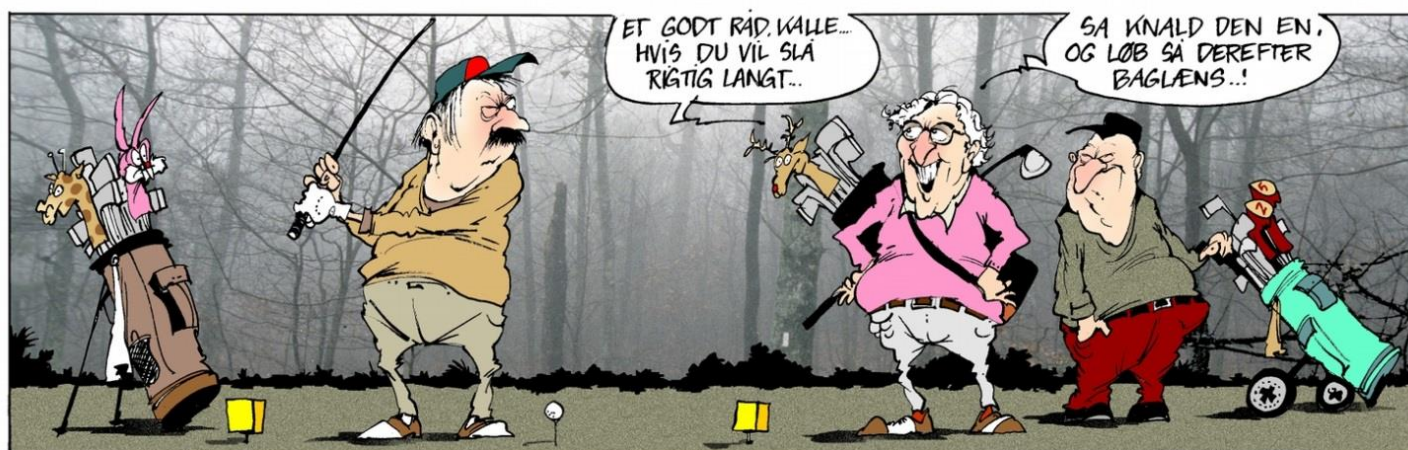
FØRSTE SLAG I DET NYE ÅR

Apriltilbud på handsker og dusin bolde: køb 3 og betal for 2 ☺